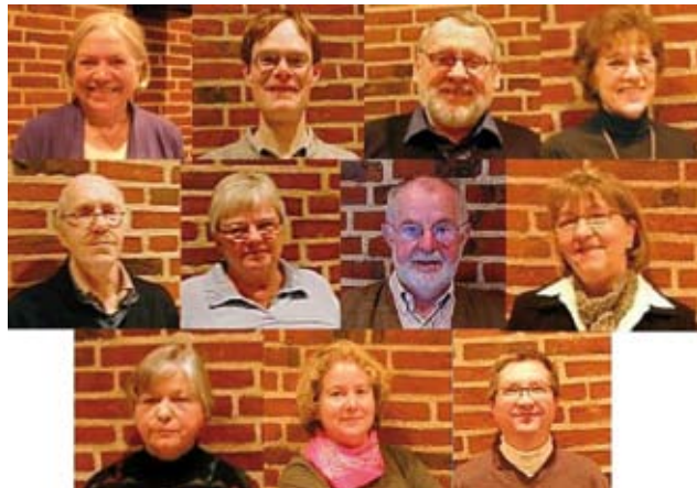
Menighedsrådet, som det ser ud indtil valget.

I Bistrup har vi yderligere et præstegårdsudvalg, der, som navnet siger, tager sig af vedligehold og tilsyn med præsteboligerne, et sogneudvalg, der tilrettelægger foredragsaftener og andre mødeaktiviteter, et kirkebladsudvalg, et koncertudvalg samt et sikkerhedsudvalg.